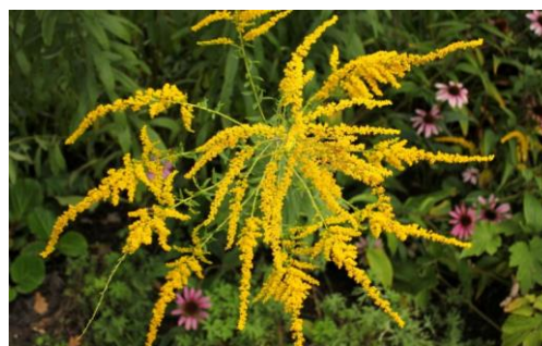
Ambrosie en fleur