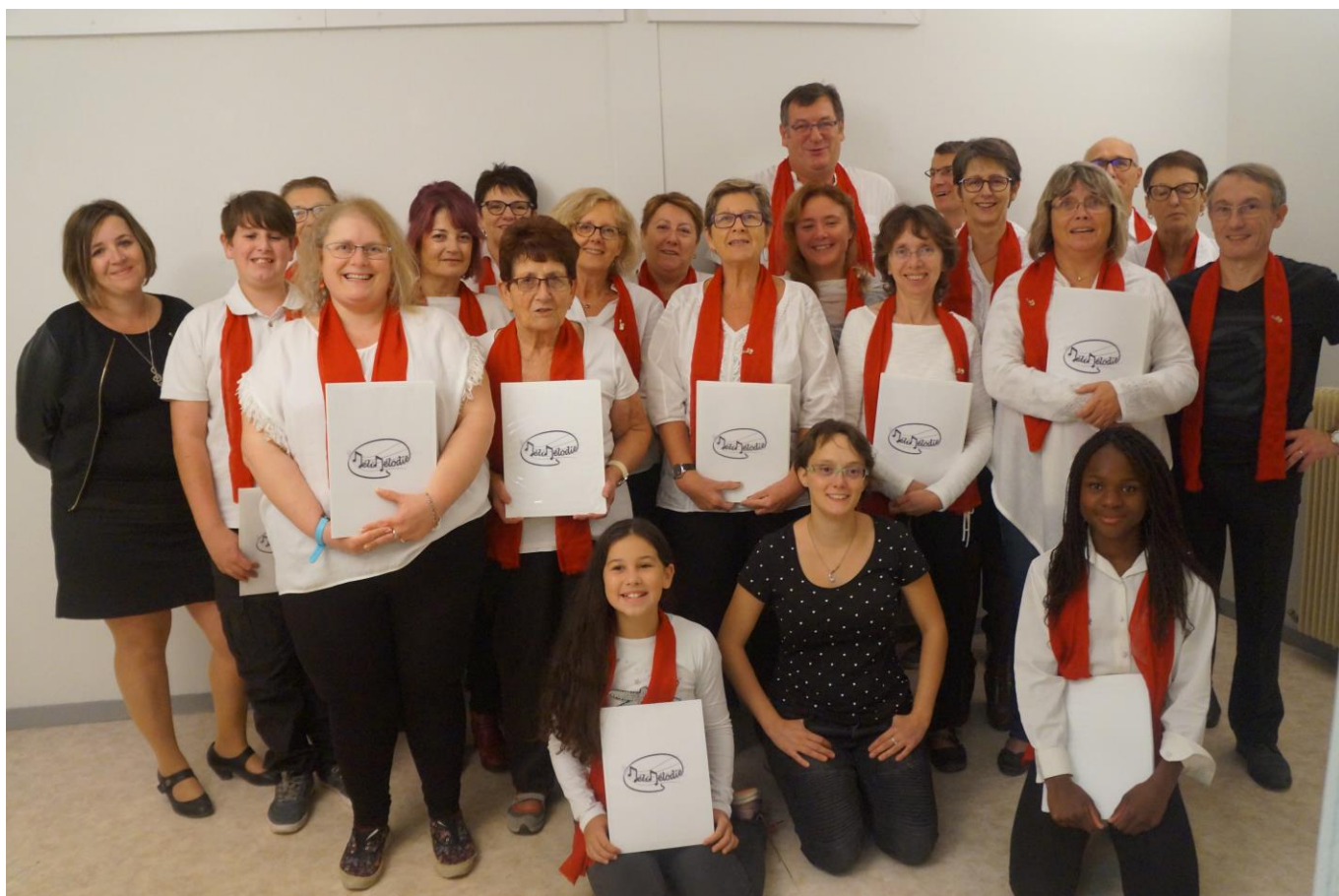
L'association Chorale Mélodie