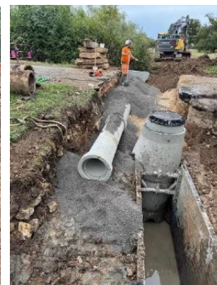
Achèvement des travaux d'assainissement côté champs, de la lagune jusqu'à la rue du moulin, qui ont débuté au mois de mai dernier