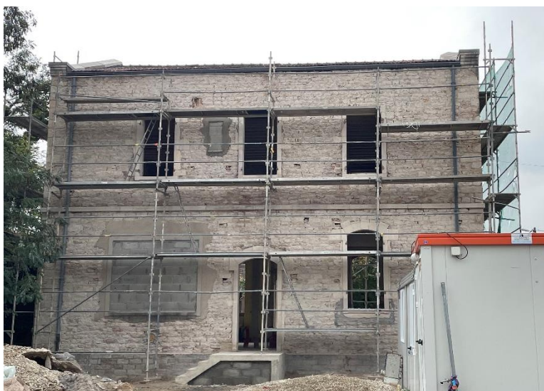
Pose des menuiseries et rénovation de la façade du bâtiment du quart Rameau