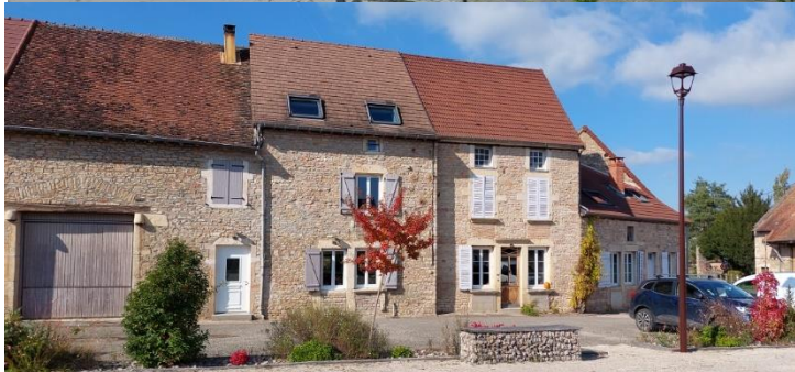
Dépose des câbles de télécommunication et électriques ainsi que des potences sur la Place Julien Bressand